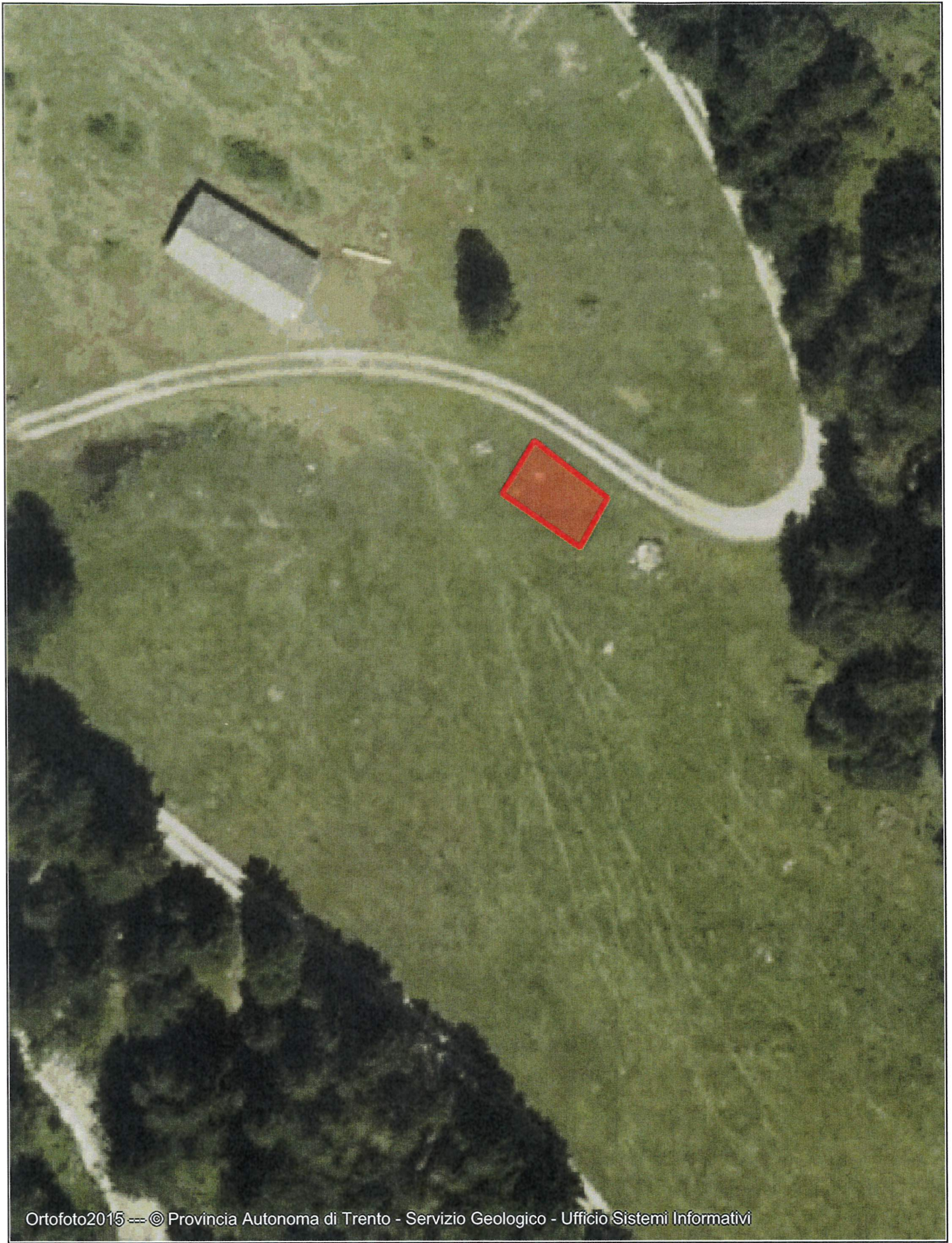
Ortofoto2015 --- © Provincia Autonoma di Trento - Servizio Geologico - Ufficio Sistemi Informativi